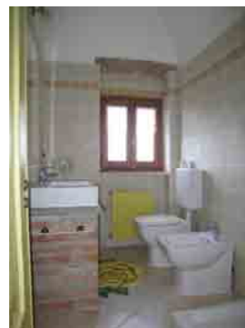
Camera e bagno "Rose gialle"

All'interno si trovano due camere, - "rose gialle" e - "rose blu", entrambe con proprio bagno privato e riscaldamento centralizzato. Sono predisposte per due persone con la possibilità di un letto aggiuntivo.