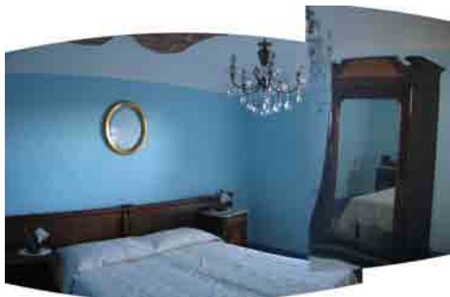
Camera e bagno "Rose blu"